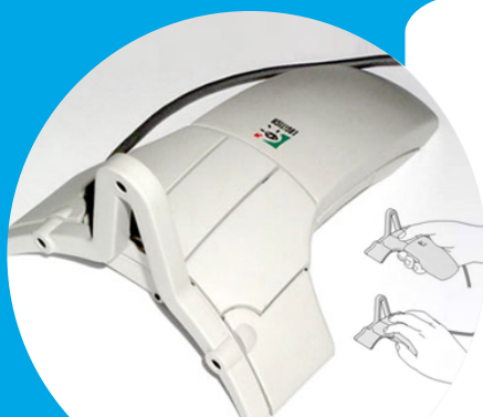
Logitech 3D Mouse